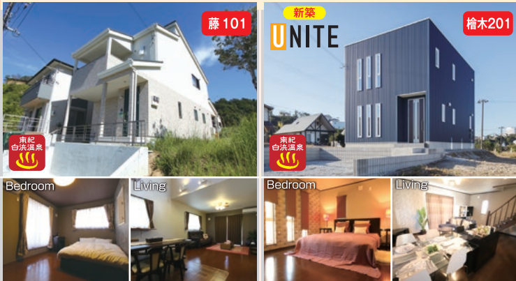
間取り・定員 / 2LDK 定員6名 床面積 / 一階51.34㎡ 二階42.23㎡ | 間取り・定員 / 4LDK 定員2名+2名 床面積 / 一階38.65㎡ 二階39.74㎡

1棟まるごと貸切りキャンペーン 開始 ぜひ、実際の貸別荘(対住宅)に1~7日間の体験賃貸して見て、触れて、発見して下さい。