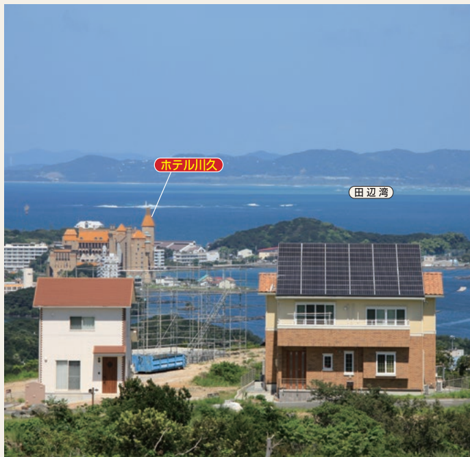
ホテル川久を建築ラッシュの白浜ホープヒルズから望む

今、テレビなどマスコミで話題の白浜温泉エリアは、過去10年で最多の観光客数344万4030人(2015年実績)発表。しかし一方では、法的な耐震診断の義務化により、多大な出費や旅館を余儀なくされる宿泊施設も出ている。そのため、観光的な注目を集めながら宿泊施設が不足する 今、テレビなどマスコミで話題の白浜温泉エリアは、過去10年で最多の観光客数344万4030人(2015年実績)発表。しかし一方では、法的な耐震診断の義務化により、多大な出費や旅館を余儀なくされる宿泊施設も出ている。そのため、観光的な注目を集めながら宿泊施設が不足する