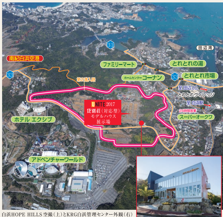
白浜HOPE HILLS空撮(上)とKRG白浜管理センター外観(右)

有者の協力を得て宿泊施設に充て、さらに約1300区画の更地を被災者の簡易宿泊施設の建設場所として提供できる。 同分譲地だけで、数千人の避難生活が可能になるため、同社の担当者は、「今後、自治体と相談して避難場所としての指定を受けたい。そうすれば地域住民に周知される。いざという時に思い出していただければ」と思っています。 海を見下ろす高台に200棟のプライベートコテージが完成すれば、観光客が安心して宿泊できる大型施設として海外から