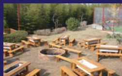
キャンプファイヤー&BBQデッキ