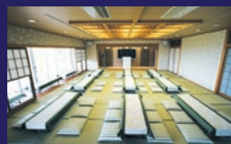
宴会場「月帰(げんぎ)の間