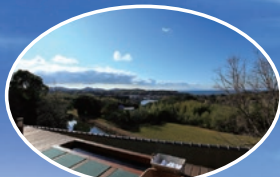
海の見える展望デッキ&足湯