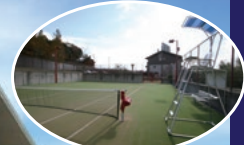
多目的テニスコート