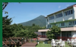
バーベキューエリア

【栃木県・那須温泉概要】●名称:会員制ホテル那須高原(テニスコート2面・展望屋外コンサート場付)●所在地:栃木県那須郡那須町大字湯本ツムジケ平213-1028、213-1024、213-1025、213-1644●敷地面積:5,608㎡(約1,696坪)●構造:鉄筋コンクリート造亜鉛メッキ銅板葺塔屋付4階建●建物延面積:1,772.28㎡(約536坪)●宿泊室(洋室14・和室2・特別室2=定員64名)●築年:昭和44年1月新築(平成24年大規模リフォーム工事済)●交通:東北新幹線「那須塩原」駅より車で50分(約32km)●引渡:即入居可